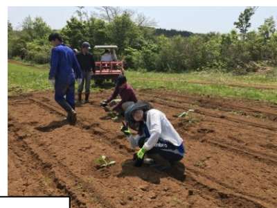
少しのお勉強と、畑での野菜作りもやります