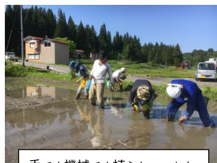
手でも機械でも植えちゃいます

【持ち物】作業着(長袖),長靴,帽子,手袋,雨具,上着,着替え,虫よけ, 健康保険証など